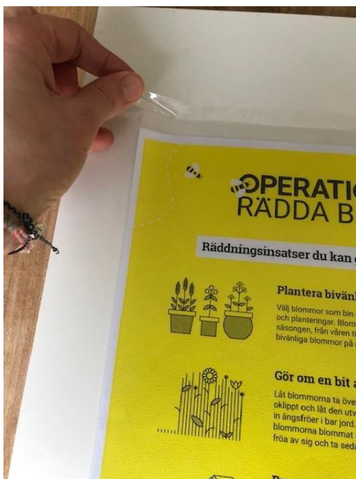
Steg 2: Tejpa fast plastfickan på bräda.