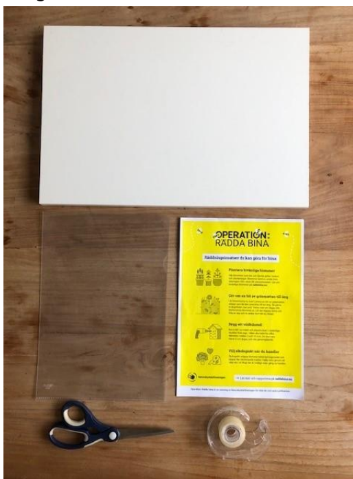
Material: Sax, tejp, plastficka, bräda, affisch ORB