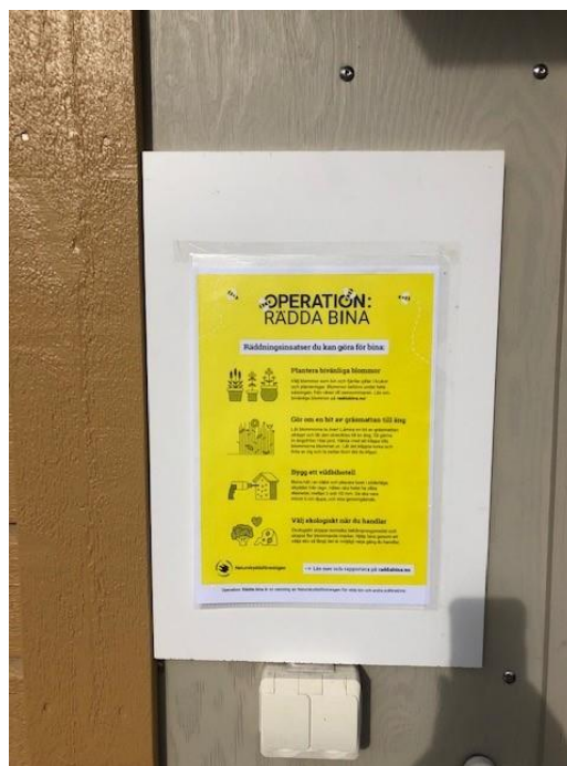
Steg 3: Sätt upp infotavlan.